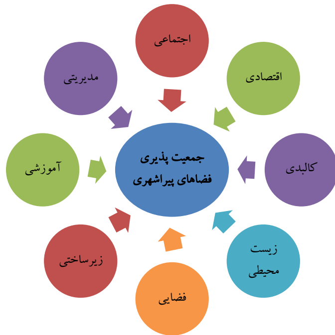
شکل ۱. مدل مفهومی پژوهش (عوامل مؤثر بر جمعیت پذیری فضاهای پیراشهری)

پژوهش حاضر است. با توجه به مطالب عنوان شده مدل مفهومی زیر را می توان برای علل مؤثر بر جمعیت پذیری فضاهای پیراشهری طراحی کرد (شکل ۱).