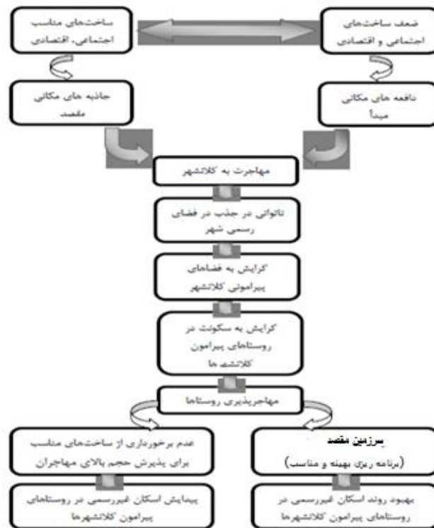
شکل ۱. مدل مفهومی پژوهش

همراه با رفع اشکالات باشد و هرگز با شتاب‌زدگی و عدم توجه به ارکان مختلف روستا، همراه نباشد. وجود نهادهای پشتیبان برای حفظ و کمک به گروه‌های آسیب‌پذیر روستایی به‌اندازه‌ی نهادهای موجود در شهر موردنیاز است و می‌تواند از گسترش و انتقال آن به شهر و ایجاد پیچیدگی‌ها جلوگیری کند. و در آخر اینکه روستاها بخش از سیستم کشورهاست که نیازمند دید جامع و مناسب به آن، و هنگام با مسائل کل کشورهاست.