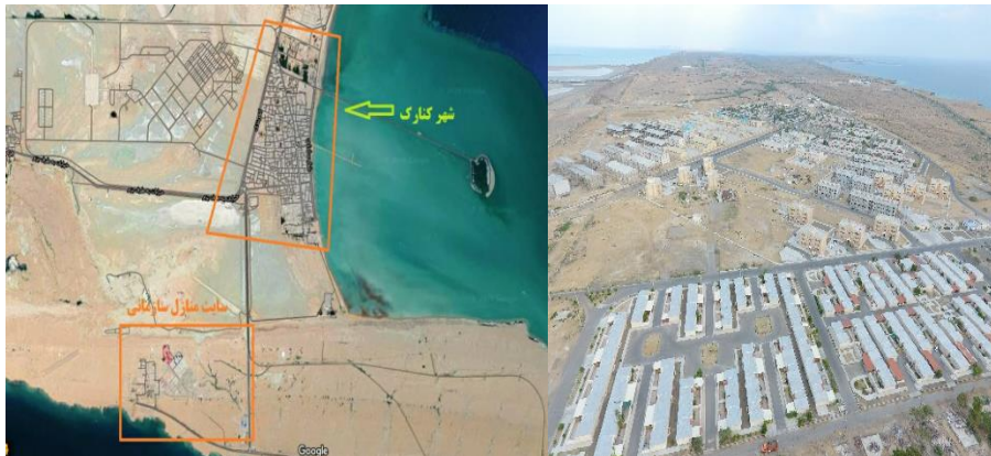
شکل ۲. تصویر هوایی از شهرک و موقعیت آن

روش تحقیق پژوهش توصیفی-تحلیلی با رویکرد کاربردی است. داده‌ها با استفاده از پرسشنامه گردآوری شده‌اند. با توجه به جمعیت منطقه برای تعیین حجم نمونه از فرمول کوکبان استفاده شد. پرسشنامه ۲۷ گویه‌ای با مشورت خبرگان معماری و روانشناسی طراحی شد و تعداد ۱۵۰ خانوار پرسنل نیروی دریایی ارتش جمهوری اسلامی ایران که در منازل سازمانی واقع در سواحل دریای عمان حضور داشتند این پرسشنامه‌ها را تکمیل کردند. لازم به ذکر است یک‌بار پرسشنامه آزمایشی با تعداد ۳۰ عدد توزیع شد و مشکلات و نکات مبهم در پرسشنامه اصلی رفع شد. برای تجزیه و تحلیل داده‌ها از نرم‌افزار Amos و SPSS استفاده شده است. بر اساس تحلیل عاملی و ساختار مسیر سعی بر آن بوده است که روابط مابین مدل چهارچوب نظری مورد بررسی و تأیید قرار گیرد که در ادامه به آن پرداخته می‌شود. کنارک در استان سیستان و بلوچستان، حاشیه چابهار (در ۵۵ کیلومتری شرق آن) و ساحل دریای عمان واقع شده. در هم‌جواری این شهرها، منازل مسکونی سازمانی متعلق به ارتش جمهوری اسلامی ایران (نیروی دریایی و هوایی) قرار دارد با طول جغرافیایی منطقه ۲۵ درجه و ۱۹ دقیقه و ۵۷ ثانیه و عرض جغرافیایی ۶۰ درجه و ۲۲ دقیقه و ۵۴ ثانیه. شهرک نیرو دریایی در مجاورت این شهر در حدود ۱۵۰۰ واحد مسکونی ویلایی و آپارتمانی قرار دارد که در شکل شماره ۱ و ۲ مشاهده می‌نمایید.