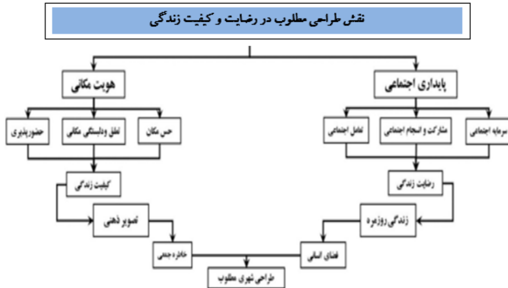
شکل ۴. مدل مفهومی پژوهش

در این پژوهش با استفاده از پرسشنامه و تحلیل آماری توسط نرم افزار SPSS و سپس برای تبیین مدل مفهومی با استفاده از نرم افزار آموس گراف به تحلیل داده‌ها پرداخته شده است. مدل مفهومی این پژوهش به صورت شکل ۴ است: