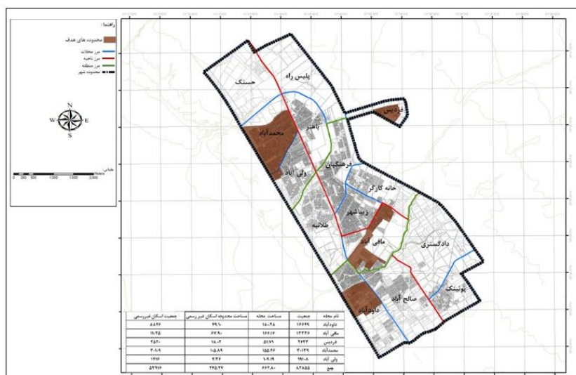
شکل ۳. موقعیت محلات هدف