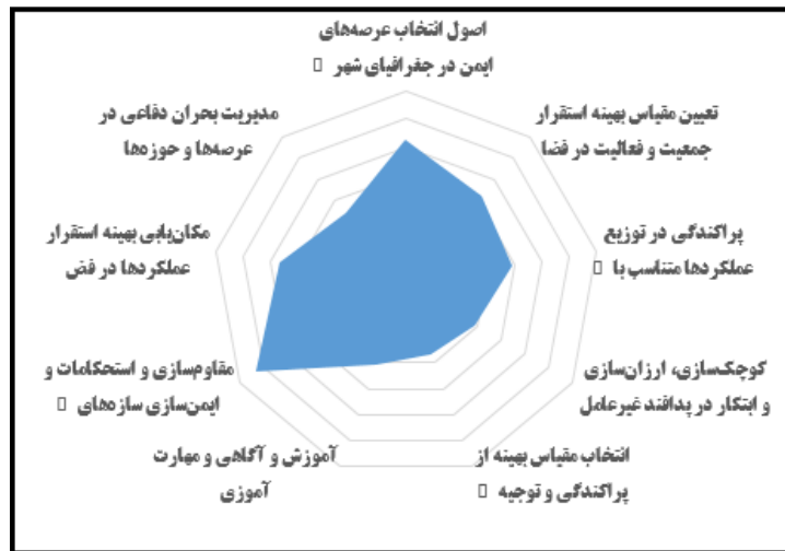
شکل ۴. میزان انطباق اصول پدافند غیرعامل با شهر قرچک

مطابق نتایج به دست آمده در اصول انتخاب عرصه‌های ایمن در جغرافیای شهر قرچک (بالاترین رتبه متعلق به اقدام ارزیابی نواحی آسیب پذیر شهر نسبت به تهدید)، در اصول تعیین مقیاس بهینه استقرار جمعیت و فعالیت در فضا نیز (بالاترین رتبه متعلق به اقدام ایجاد مطلوب‌ترین میزان جمعیت و یا فعالیت مستقر در یک موقعیت)، در اصول پراکندگی در توزیع عملکردها متناسب با تهدیدات و جغرافیای شهر قرچک نیز (بالاترین رتبه متعلق به اقدام آنالیز و بررسی انواع عملکردها و کارکردها در هر سیستم و پروژه) و در اصول کوچک‌سازی، ارزان‌سازی و ابتکار در پدافند غیرعامل نیز، (بالاترین رتبه متعلق به اقدام جلوگیری از افزایش هزینه‌های اجرائی در اجرای طرح‌ها)، در اصول انتخاب مقیاس بهینه از پراکندگی و توجیه اقتصادی پروژه‌ها (بالاترین رتبه متعلق به اقدام تعریف و درجه‌بندی میزان امنیت برای هر طرح در برابر تهدید)، همچنین در اصول آموزش و آگاهی و مهارت آموزشی (بالاترین رتبه متعلق به اقدام بهره‌گیری از انواع روش‌های آموزش و یادگیری شامل کتب، بروشور، کلاس‌های تخصصی)، در اصول مقاوم‌سازی و استحکامات و ایمن‌سازی سازه‌های حیاتی (بالاترین رتبه متعلق به اقدام تعیین میزان ایمنی هر سیستم در برابر تهدید و درجه‌بندی آنها)، در اصول مکان‌یابی بهینه استقرار عملکردها در فضا (بالاترین رتبه متعلق به اقدام استفاده از استانداردهای فنی مقاوم در سازه‌های حیاتی و حساس) در نهایت، اصول مدیریت بحران دفاعی در عرصه‌ها و حوزه‌ها (بالاترین رتبه متعلق به اقدام مدیریت بحران به منظور مدیریت بر حوادث، تبعات)، می‌باشد.