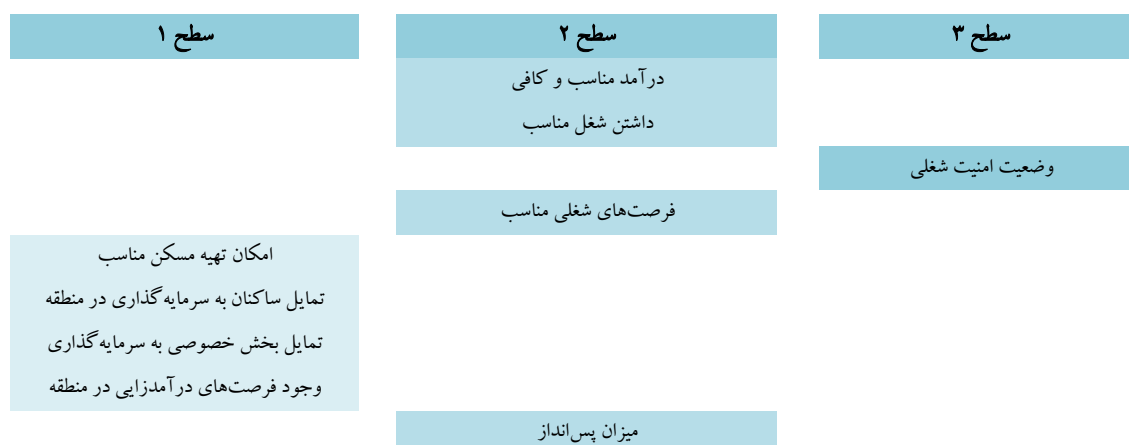
شکل ۲. مدل توسعه داده‌شده با تکنیک ISM مرتبط با شاخص‌های مؤثر بر زیست‌پذیری اقتصادی کوی فاطمیه

در نهایت نتایج مربوط به این سطح‌بندی در شکل شماره (۲) نشان داده شده است. شاخص‌هایی که در سطح پایین مدل ساختاری تفسیری قرار گرفته‌اند نسبت به سایر شاخص‌ها، اثر گذارتر می‌باشند.