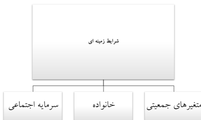
شکل ۴. شرایط زمینه‌ای

«من واقعا همه‌ی این مجموعه و تولیدی رو مدیون دوستانم هستم. اگه حمایت و همراهیشون نبود حتی یک ساعت ادامه پیدا نمی‌کرد. بچه‌ها هر کدوم یه گوشه کارو گرفتن و اینی شد که امروز میبینید»