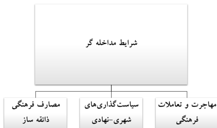
شکل ۵. شرایط مداخله‌گر

از دیگر متغیرهای مداخله‌گر در مسیر مورد اشاره تأثیر مصارف فرهنگی‌ای است که الهام‌بخش ذائقه‌ی مخاطبین می‌شوند. زندگی در عصر ارتباطات که محصولات رسانه‌ای گوناگون به‌طور دائم و در جای‌جای زندگی روزمره مورد مصرف قرار می‌گیرند ذهن مردم و جامعه را نسبت به هر ابژه‌ای در وضعیت مقایسه‌ای قرار می‌دهد. وضعیتی که هر کنشی را در این مسیر تحت تأثیر محصولات رسانه‌ای قرار می‌دهد و به اصطلاح آن‌ها را رسانه زده می‌کند. «این روزها هر روز بچه هامون دارن انواع تبلیغات و فیلم‌ها و کارتون‌های مختلف و متنوع می‌بینن. به نظر شما الان با اینا میشه از هویت و فرهنگ و تاریخ صحبت کرد؟»