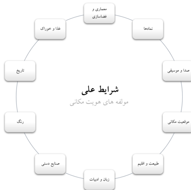
شکل ۳. مؤلفه‌های هویت مکانی

«شما به من بگید یک کلیپ یا فیلم کوتاه از طبیعت رشت چقدر ارزشمند و چه میزان می‌تونه مخاطب رو به حضور و بهره‌مندی از محیط رشت ترغیب کنه؟»