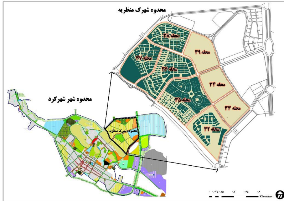
شکل ۱. نقشه موقعیت جغرافیایی محدوده مورد مطالعه