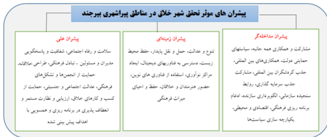
شکل ۲. ترسیم پیشنهادهای مؤثر تحقق خلاقیت در مناطق پیراشهری