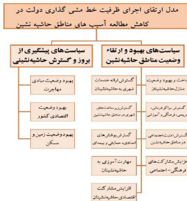
شکل ۳. مدل ارتقای اجرای ظرفیت خط مشی گذاری دولت در کاهش مطالعه آسیب های مناطق حاشیه نشین شهرهای سیستان و بلوچستان